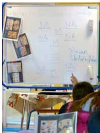
en atelier d'écriture