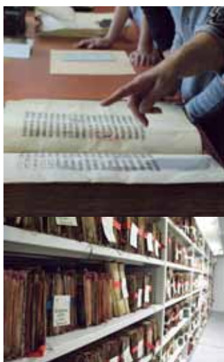
aux Archives départementales 33